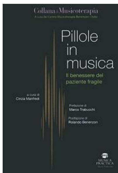
Figura 5 PILLOLE IN MUSICA

La Pelle che Vibra , Il laboratorio di percussioni in Musicoterapia, Animazione e Didattica con contributi di Stefano Navone – Borghini Giorgio