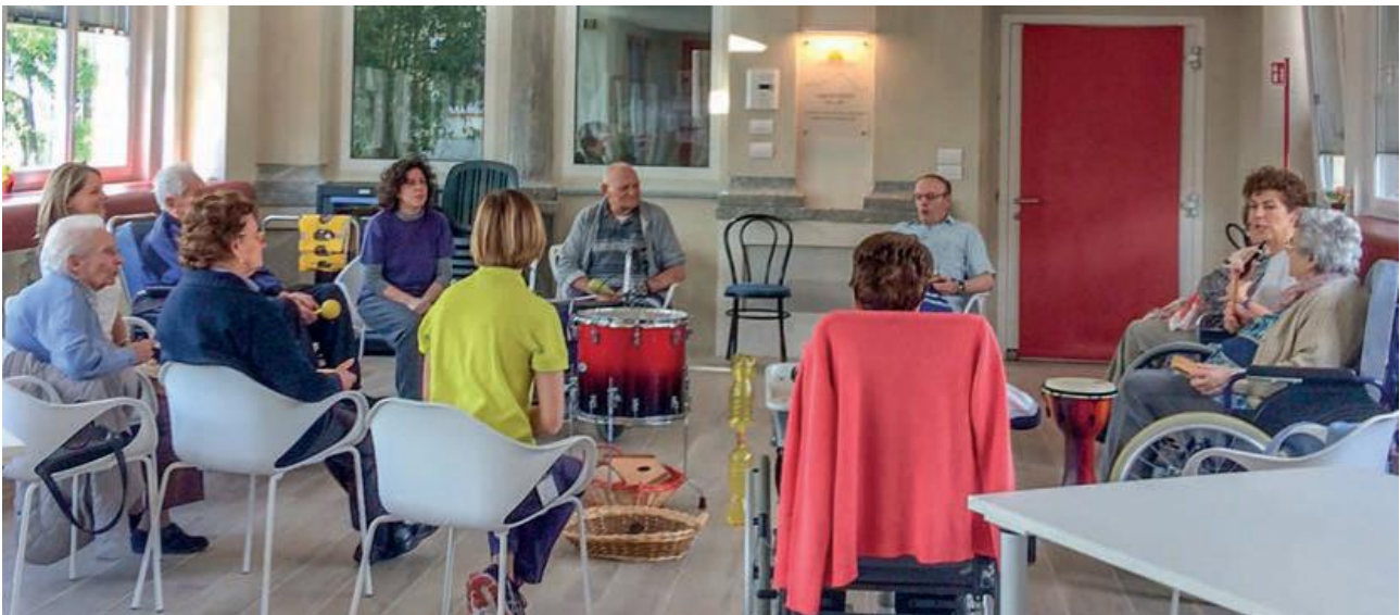
Figura 1LE SEDUTE DI MUSICOTERAPIA IN RSA

Pazienti privati presso la Sede e a domicilio