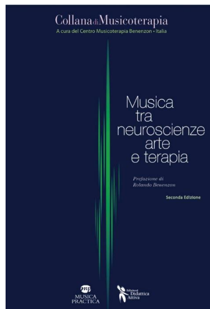
Figura 3 MUSICA TRA NEUROSCIENZE ARTE E TERAPIA