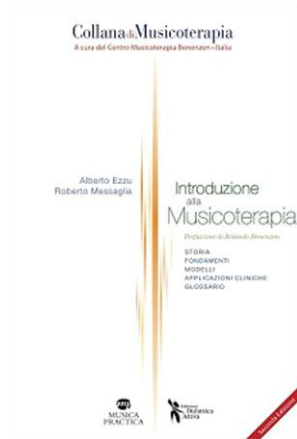
Figura 2 INTRODUZIONE ALLA MUSICOTERAPIA