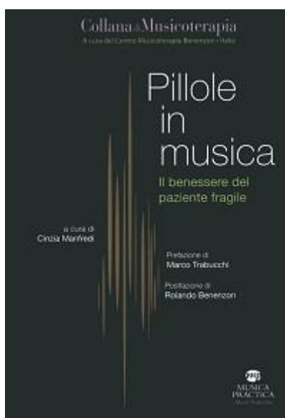
Figura 5 PILLOLE IN MUSICA

La Pelle che Vibra , Il laboratorio di percussioni in Musicoterapia, Animazione e Didattica con contributi di Stefano Navone – Borghini Giorgio