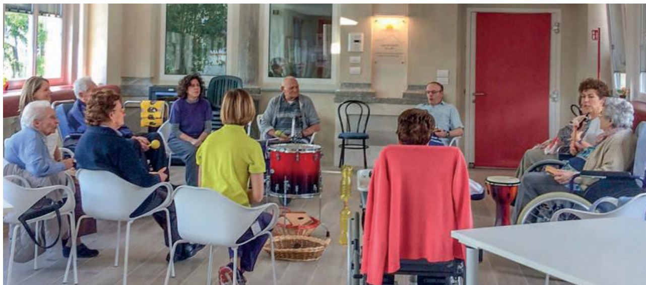
Figura 1 LE SEDUTE DI MUSICOTERAPIA IN RSA