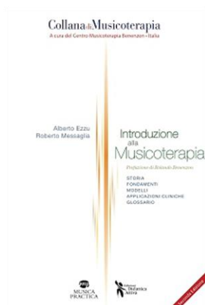
Figura 2INTRODUZIONE ALLA MUSICOTERAPIA

Musica Practica-Vogolino Editrice Torino