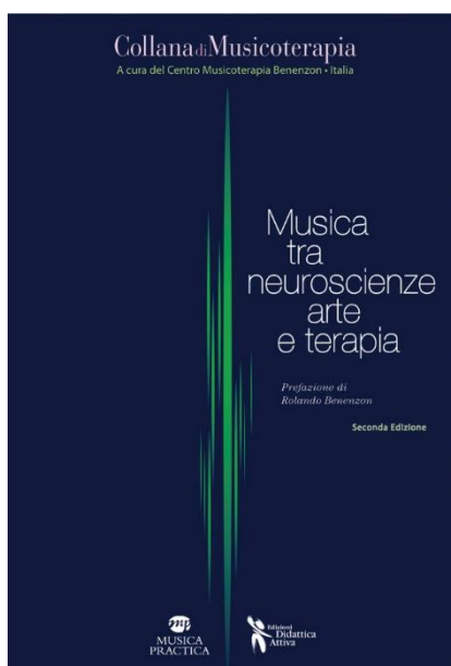
Figura 3MUSICA TRA NEUROSCIENZE ARTE E TERAPIA