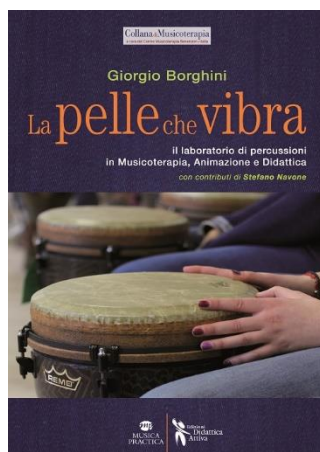
Figura 4 LA PELLE CHE VIBRA

La Pelle che Vibra , Il laboratorio di percussioni in Musicoterapia, Animazione e Didattica con contributi di Stefano Navone – Borghini Giorgio